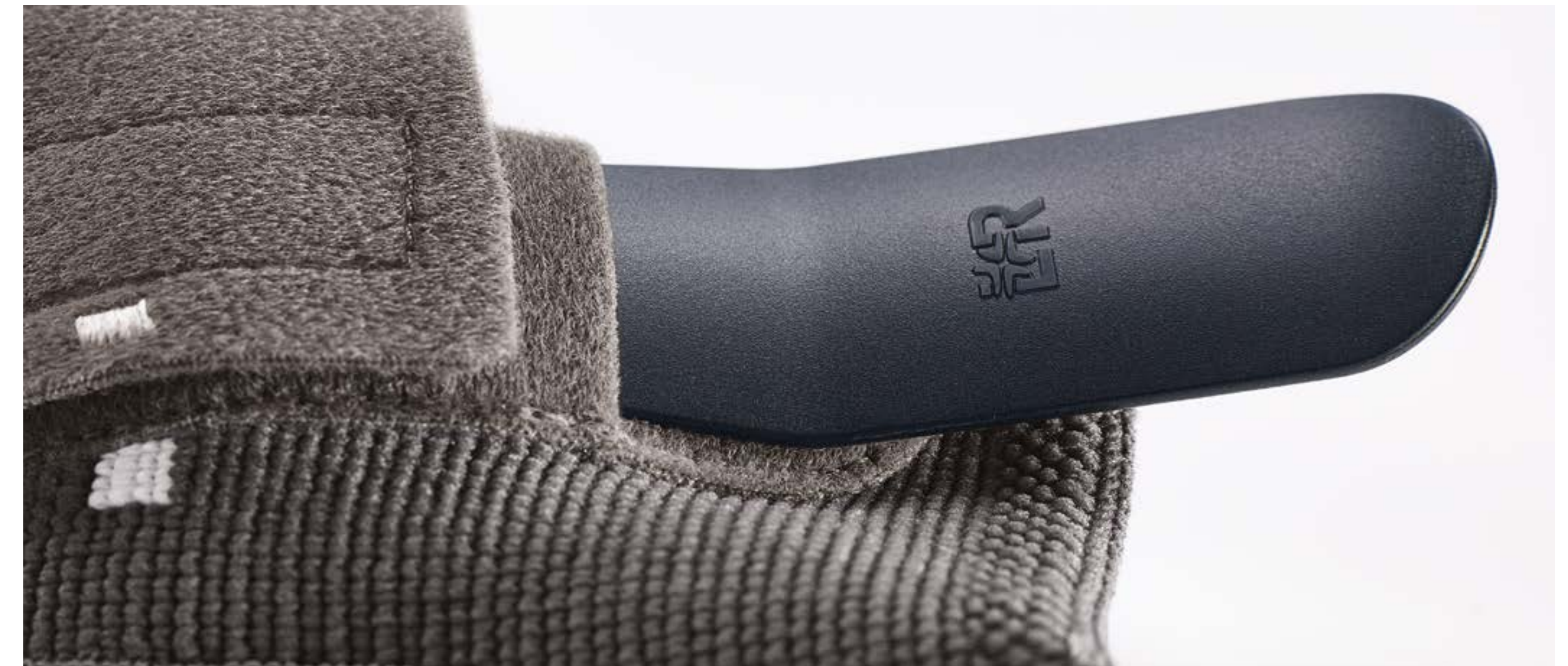
Eenvoudig verwijderen van de stabilisatiestaaf