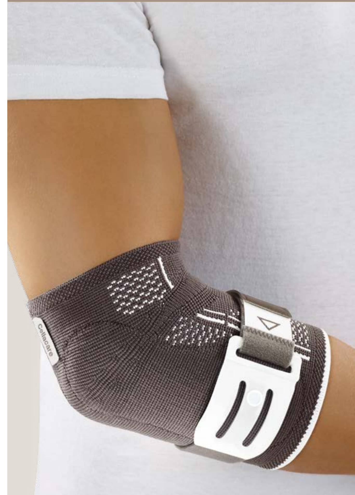
Cellacare® Epi Comfort