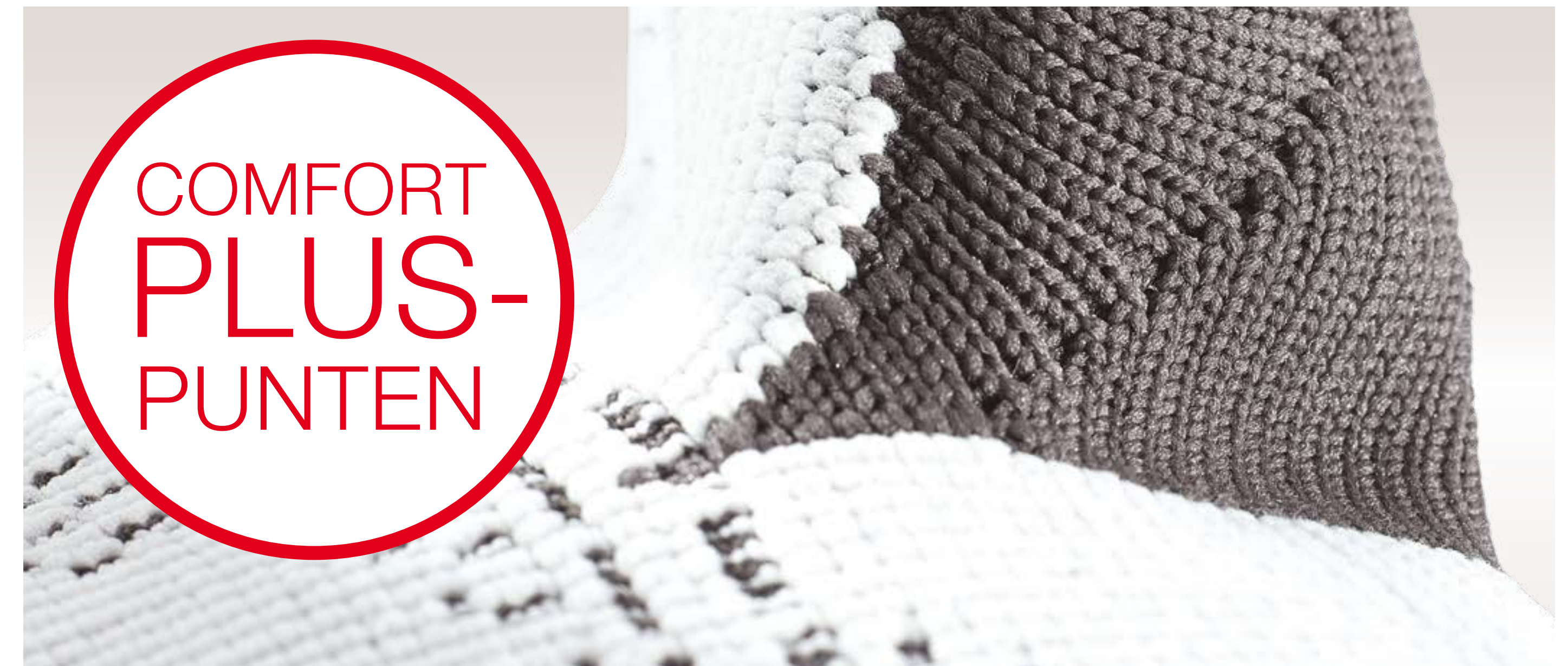
Zacht microvezelmateriaal aan de binnenkant