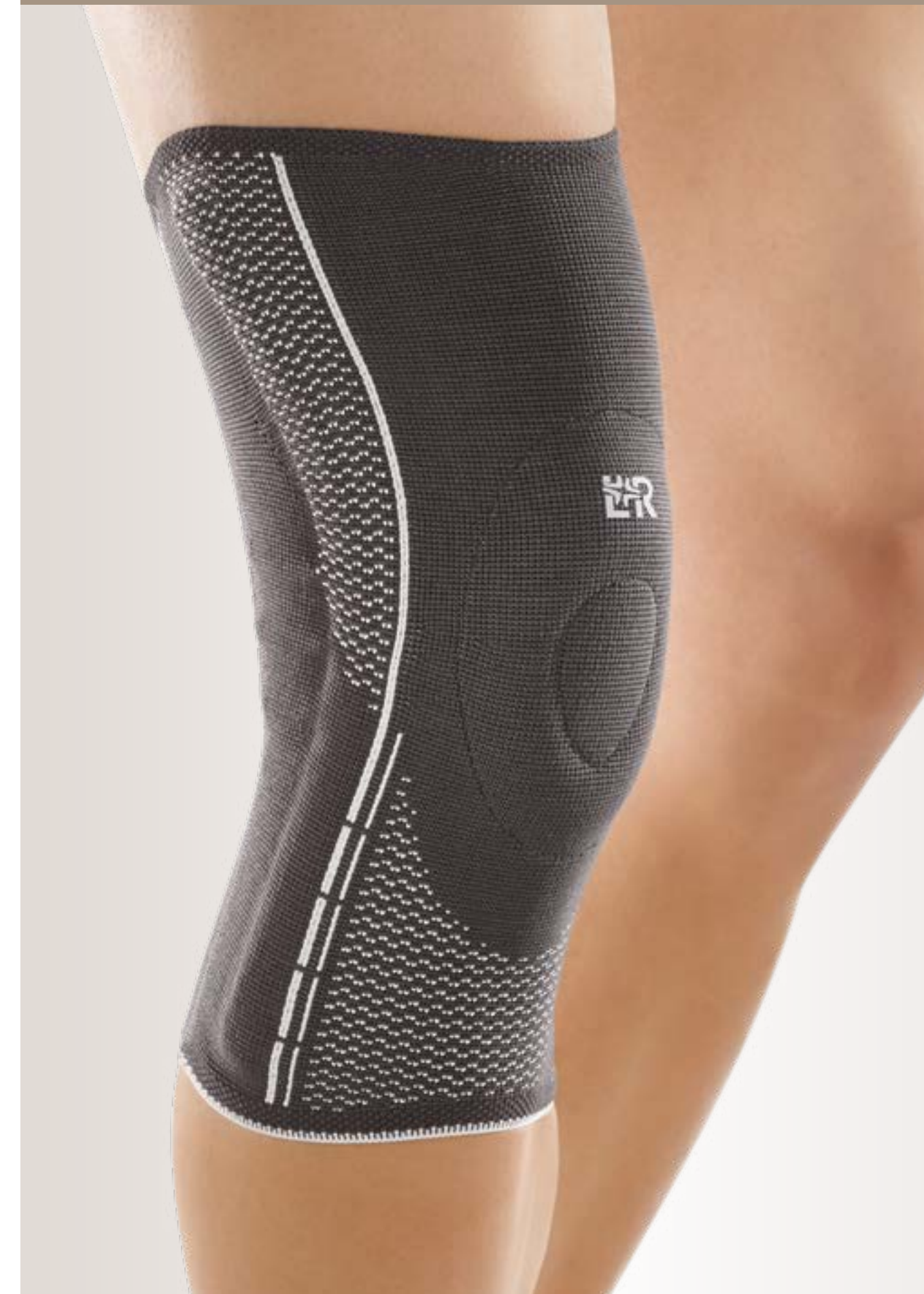
Cellacare® Genu Comfort