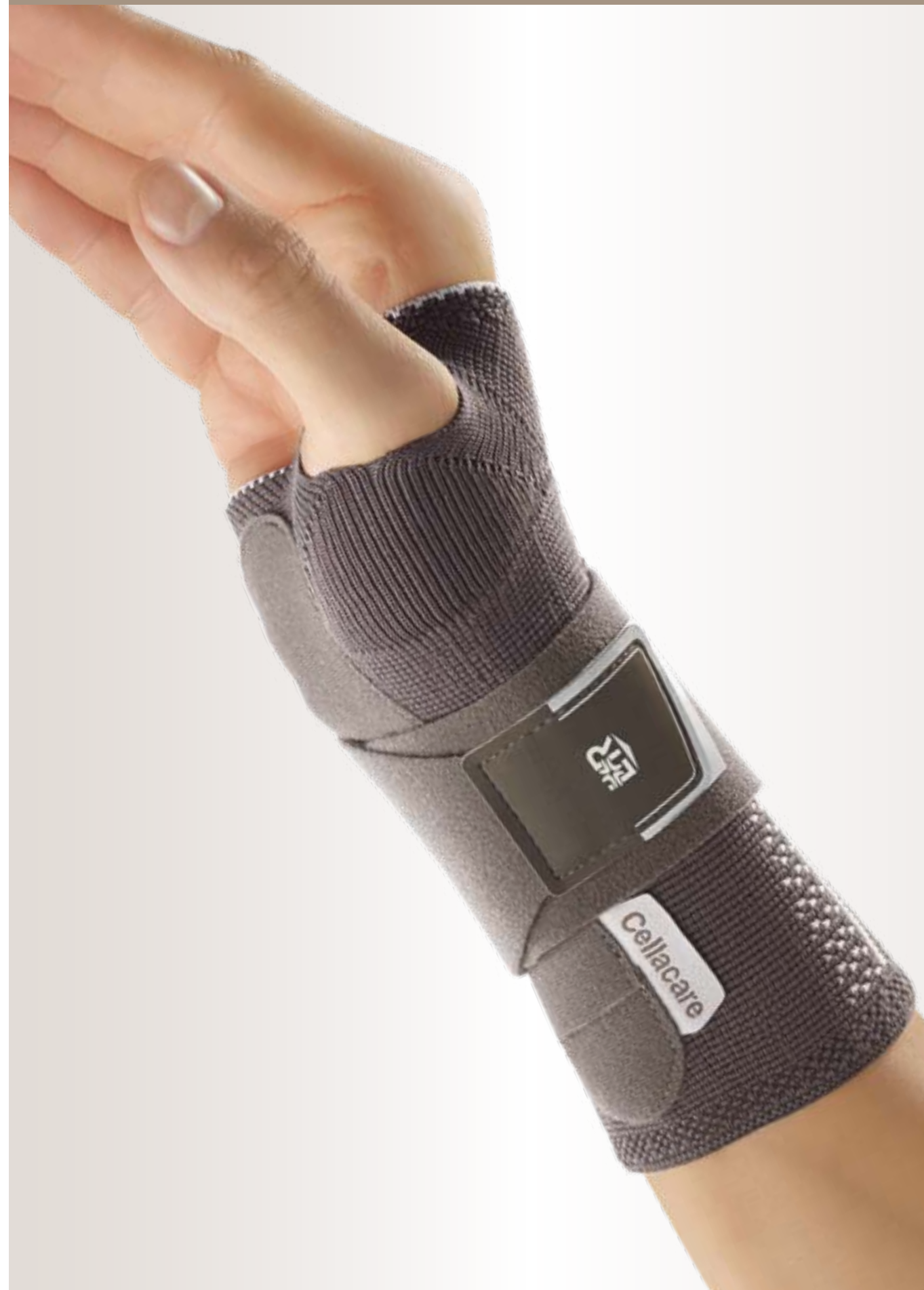
Cellacare® Manus Comfort