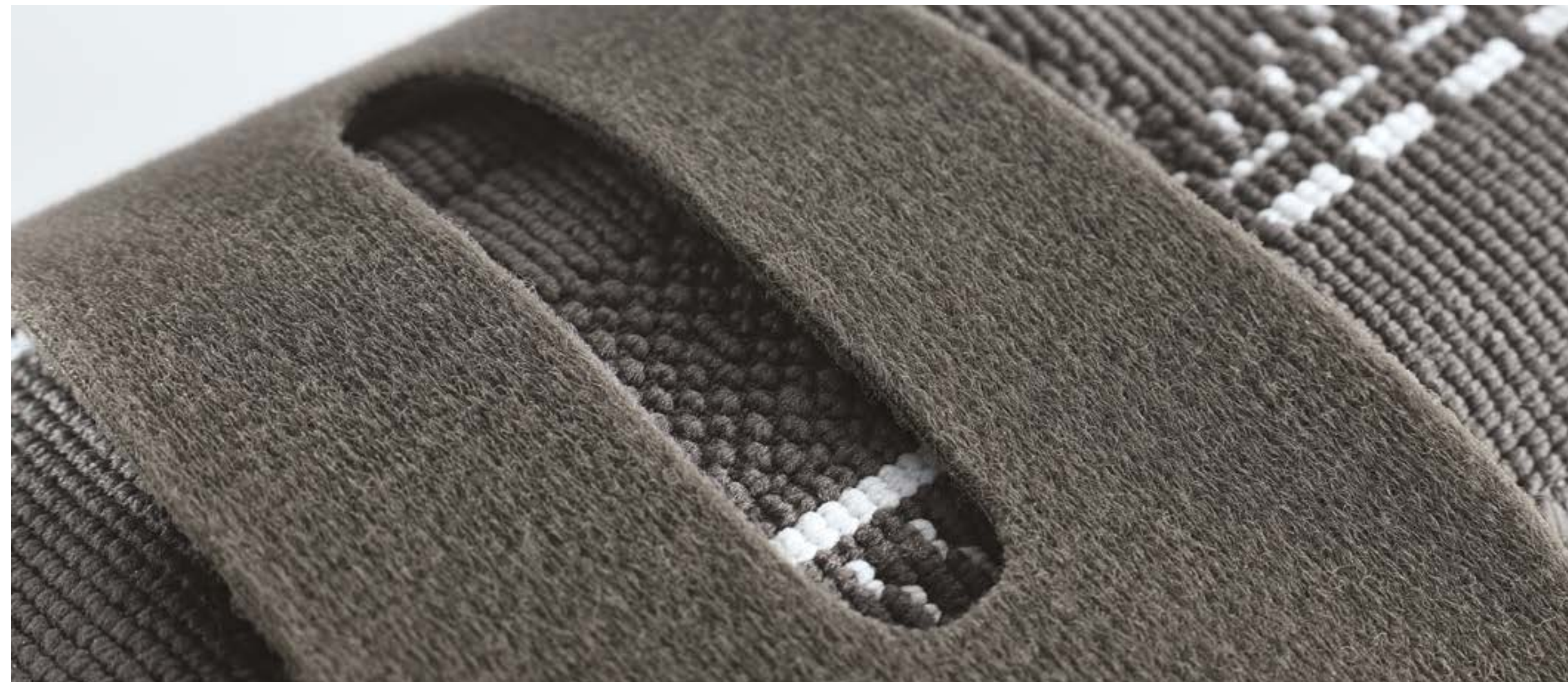
Doelgerichte drukontlasting door uitsparing in de band

Door een hoog draagcomfort is het voor de patiënt eenvoudiger om de bandage continu te dragen.