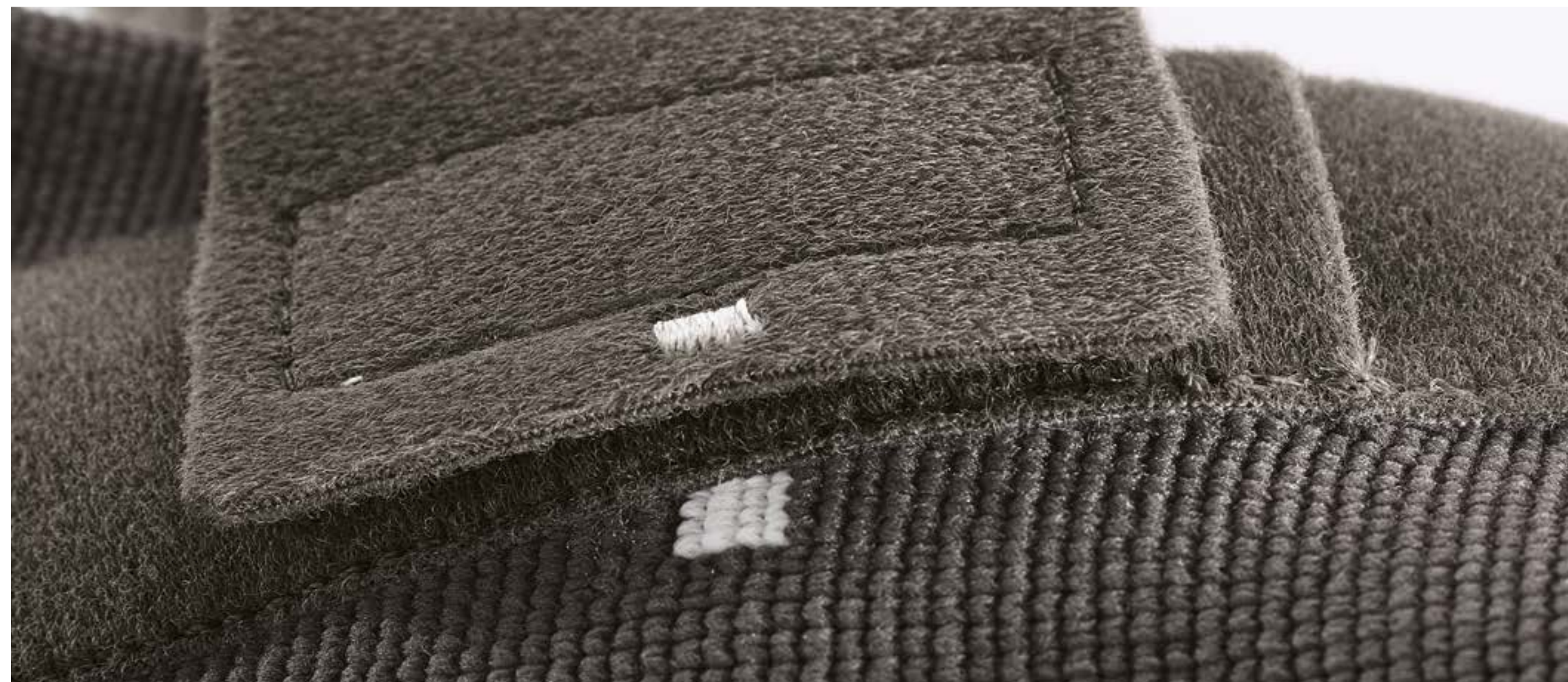
Visuele gebruiksinstructies op het product